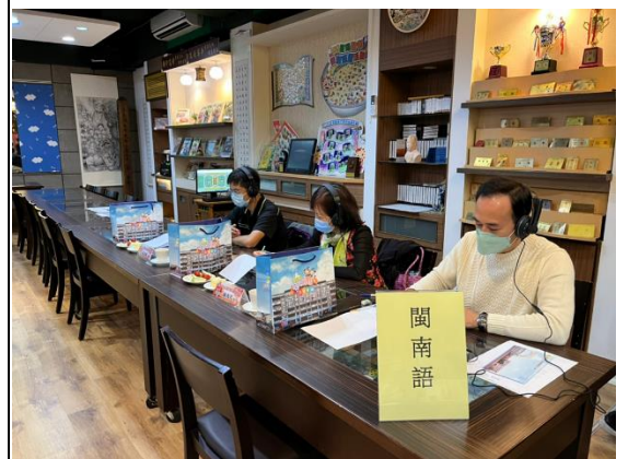
說唱讚作品評審會議