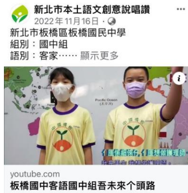
說唱讚得獎作品與平台推播